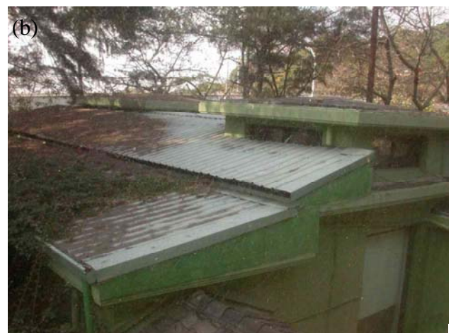
圖 1 (a)蔣公行館外牆為草綠色，屋頂為日式瓦片，部分外牆漆色有差異；(b)部分建築物屋頂已改為鐵皮。